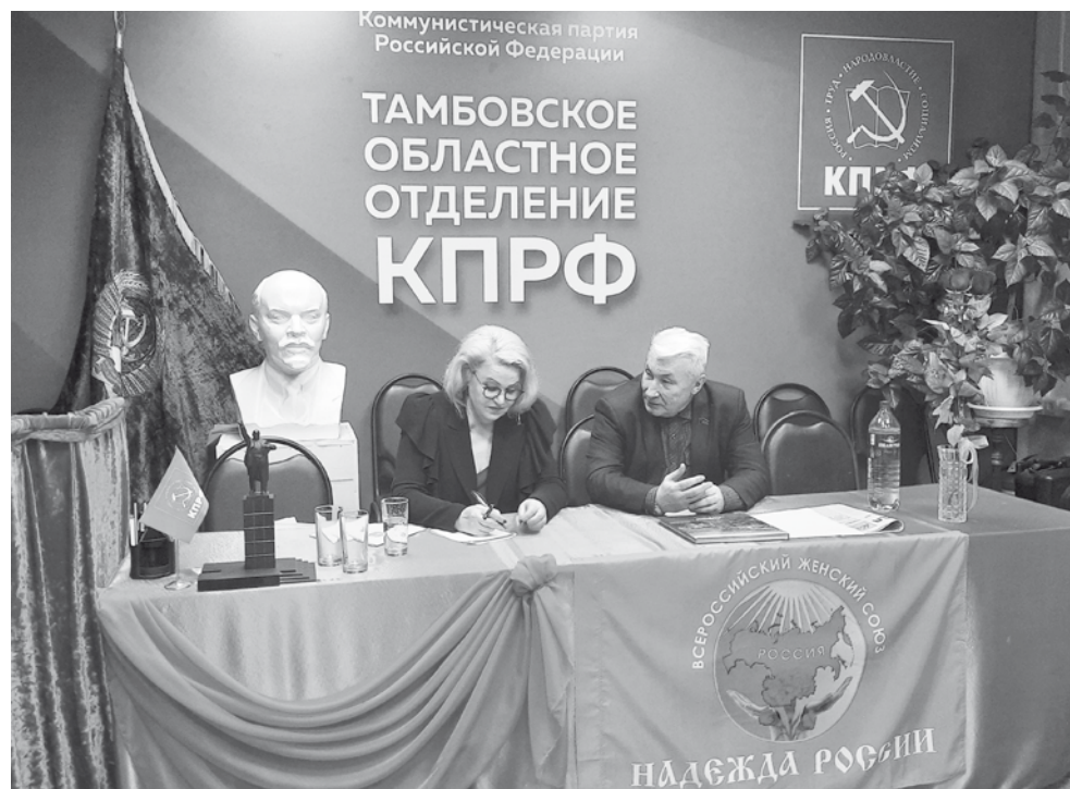
График встреч и посещений члена ЦК КПРФ поражает своей насыщенностью. Это стиль работы депутата Госдумы от КПРФ, выработанный годами. Вот и в этот раз работа началась с рабочих совещаний в правительстве Тамбовской области, с встреч с депутатами областной Думы. Делегация Госдумы посетила перинатальный центр, встретила с представителями студенческого сообщества и ознакомила с работой центра социальной поддержки граждан.

5-6 февраля в Тамбовской области работала председатель Комитета Госдумы по защите семьи, вопросам отцовства, материнства и детства, председатель ВЖС «Надежда России» Нина Александровна Останина .